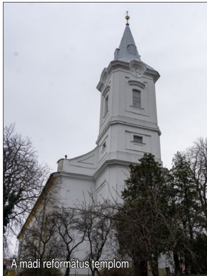
A mádi református templom

ben. Mádi sétánk híre elterjedhetett a helyi macskák és kutyák körében is, mert közülük többen is kihasználták a lehetőséget, és némi potyasimogatásért kiálltak a kapukba. Leereszkedtünk a Mádi-patak völgyébe a dimbes-dombos falu kis utcáin, hogy egy kis hídon való átkelés után ismét kicsit felfelé vegyük az irányt a református templomhoz és a domboldalba épült parókia alatti borospincéhez.