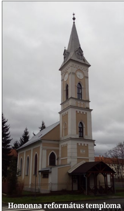
Homonna református temploma

értem, kell a bűnnel terhelt lelkünknek, hogy halljuk, hogy elgondolkodjunk arról, hogyan rendelte el Jézus az úrvacsorát, hogyan alázta meg magát és mosta meg a tanítványok lábát, hogyan imádkozott vérverejtékkel homlokán, miként kínozták és halt meg a kereszten. Míg az élet győzött, sok minden történt, míg Krisztus elhozta az új életet, szükségszerűen követték egymást nehéz órák és percek.