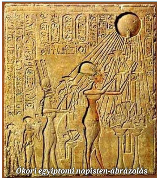
Ókori egyiptomi napisten-ábrázolás

A Biblia nem cáfolja meg a Föld keletkezésének körülményeit. Éppen arról beszél, hogy a kialakult, élettelen káoszba belép a Teremtő Isten, és elkezdődik a „rendrakás”: külön választja az égi és földi vizeket. Létrejön a szárazföld, elkezdődik az élet. Charles Darwin arra építette az elméletét – amelyet azóta is sokan tényként és nem pedig helyén, tehát nem elméletként kezelik – hogy az élet a véletlenek összjátékaként, és a legalkalmazkodóbb (tévesen idézik, hogy a legerősebb) élőlények túlélési folyamataként jött létre. Ha ez igaz volna, akkor miért állt meg a véletlenek egybeesése? Az élet megteremtése a semmiből – erre mind a mai napig képtelen az emberiség. Semmilyen vegyület nem kel életre csak úgy, véletlenszerűen.