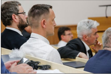
A zsinati ülés résztvevői

Jelentése tartalmazta a 2023. évi állami támogatással való gazdálkodást, egyházunk kiadásait és bevételeit, bankszámlák egyenlegét, a Közalap gazdálkodását és a Zsinati Számvevő Bizottság által elvégzett ellenőrzést.