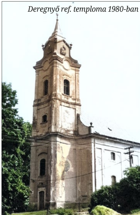
Deregnyő ref. temploma 1980-ban

A következő hét már az esküvői készülődés je-