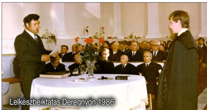
Lelkészbektatás Deregyön 1986